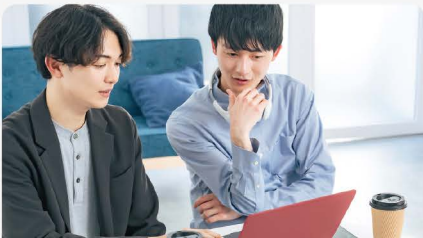
勉強会・情報交換会

教育施設や企業、保育園等さまざまな場所で講演いたします。子どもを産み育てる可能性のある女性の生き方や、ワークライフインテグレーション、産後パートナーシップ、子育てのイライラ等、幅広いテーマをご用意しています。