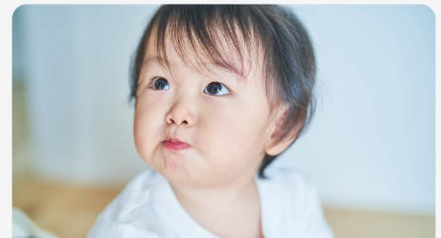
学生向け命の授業

この先自分が親になる可能性とそれを視野に入れたライフデザインををお伝えします。様々なロールモデルによる事例を通し、親になる人生の世界の広がりをお見せします。