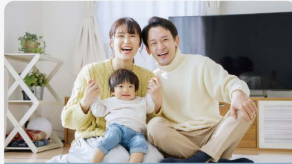
産前産後ケア普及活動

産前産後の知識をママだけではなくパパにも知っていただくため、医療機関、教育機関、行政機関にて両親学級を開催しています。